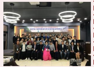
ニサモ主催の交流会

10月27日～30日の3泊4日で、新潟市の交流協定都市である韓国・ウルサン市を訪問してきました。