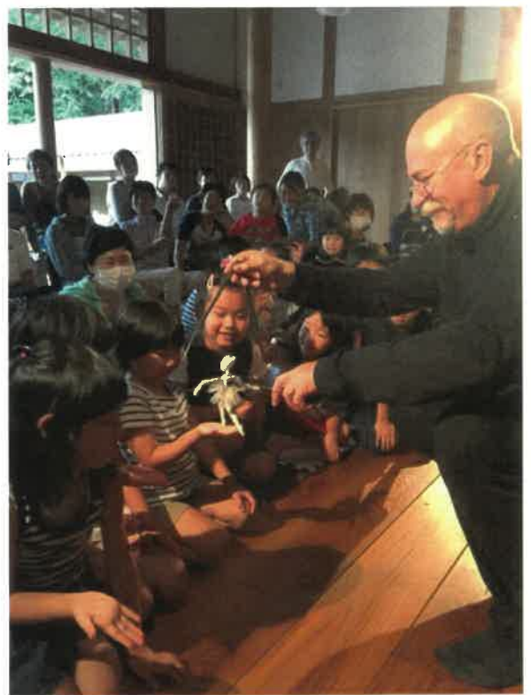
昼の部終演後、子どもたちとの交流