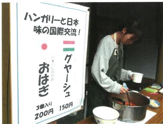
ハンガリー伝統の家庭料理を味わうコーナー