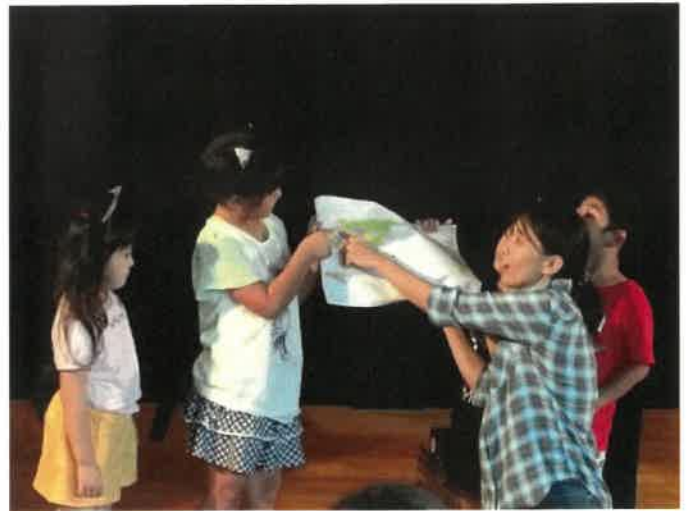
子どもたちが地図でハンガリーを紹介